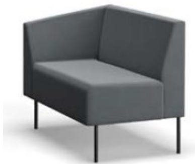
Vega Task sofa